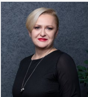
Ivana Gažić, predsjednica Uprave Zagrebačke burze

Zahvaljujemo svima koji su svojim sudjelovanjem u izradi ovoga Kodeksa korporativnog upravljanja doprinijeli definiranju novih ciljeva i prepoznavanju mogućih izazova te na taj način postavili očekivanja za buduća postupanja društava.