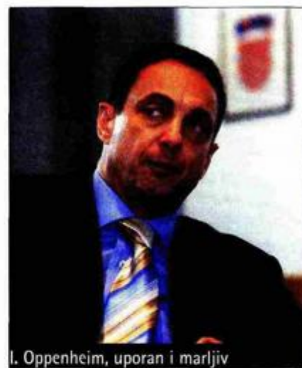
I. Oppenheim, uporan i marljiv

Vipnet, koji je zadržao lanjsku 14. poziciju na listi najuglednijih, menadžeri percipiraju suvremeno organiziranom kompanijom sa