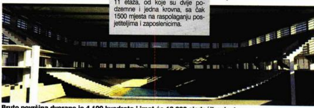
Bruto površina dvorane je 4.100 kvadrata i imat će 12.000 sjedećih mjesta

No, kada je trebalo i formalno donijeti odluku o gradnji dvorane, a samo tri mjeseca uoči parlamentarnih izbora prošle godine, svi su redom podignuli ruke. Gradsko vijeće tada je, kao rijetko kad, bilo jednoglasno.