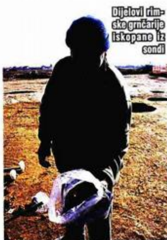
Dijelovi rimsko-grnčarije iskopane iz sondi

Radove na dionici izvodi Poslovna udruga Swietelsky iz Austrije kao