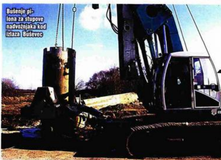
Bušenje pilona za stupove nadvožnjaka kod izlaza Buševac