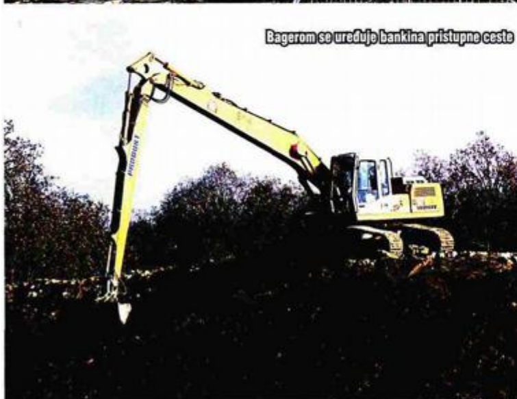
Bagerom se uređuje bankina pristupne ceste