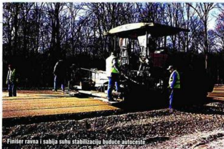
Finiser ravna i sabija suhu stabilizaciju buduće autoceste