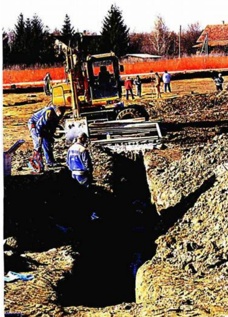
Arheolozi su na trasi pronašli srednjovjekovno selo. (u drugom planu) Zaštitni radovi usporavaju gradnju autoceste, ali graditelji gdje mogu postavljaju instalacije u zemlju