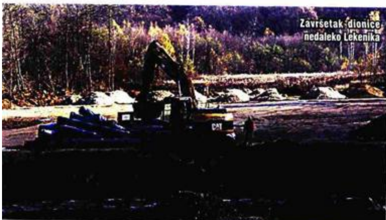
Završetak dionice nedaleko Lekenika