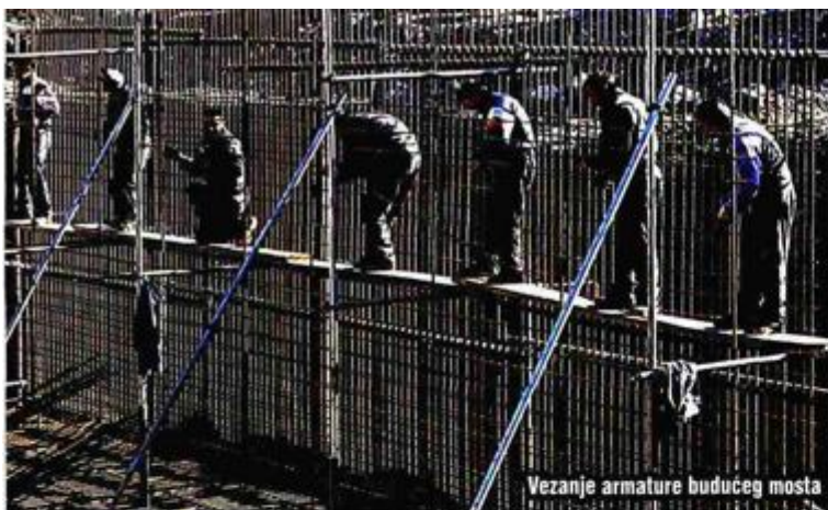
Vežanje armature budućeg mosta