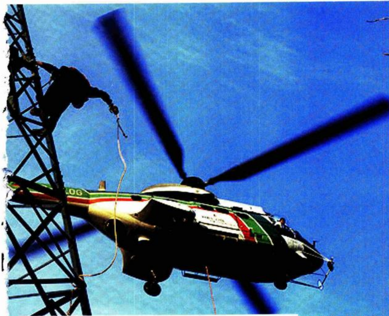
DALEKOVOD d.d. Nakon završetka zahtjevnog objekta, otvaraju im se novi poslovi u Kazahstanu